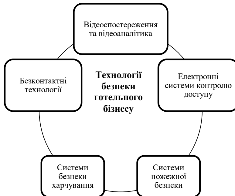
Рис.1. Технології безпеки готельного бізнесу

Готельний бізнес є одним з найважливіших секторів господарства в багатьох країнах світу. Проте з огляду на природу цього бізнесу, забезпечення безпеки є однією з ключових проблем, з якими зустрічаються готелі та курортні заклади. Сьогодні, з розвитком новітніх технологій, є багато способів, які допомагають готелям забезпечувати безпеку своїх гостей та працівників.